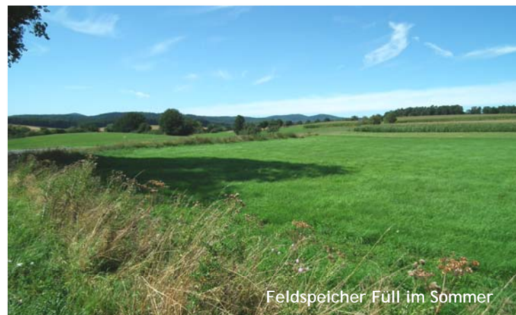
Feldspeicher Füll im Sommer

Feldspeicher können auch gezielt angelegt werden und in Kombination mehrerer solcher dezentraler Rückhalteflächen können sie deutliche Beiträge zum Hochwasserschutz leisten.