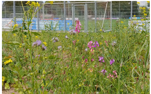
Blumenbeet am Sportplatz