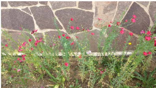
Blumenbeet in einem Privatgarten