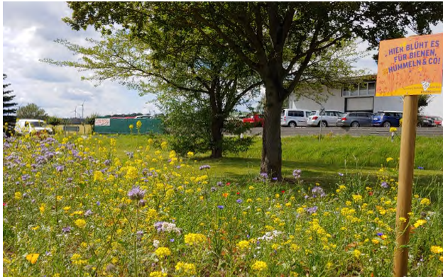
Blumenbeet bei Lidl